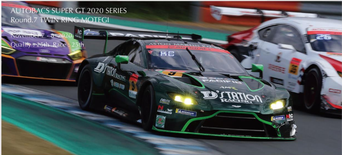
AUTOBACS SUPER GT 2020 SERIES Round.7 TWIN RING MOTEGI

November 7 - 8, 2020 Qualify : 25th Race : 25th